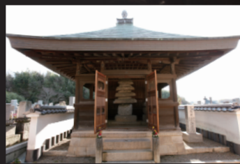
聖徳太子三尼公御廟所